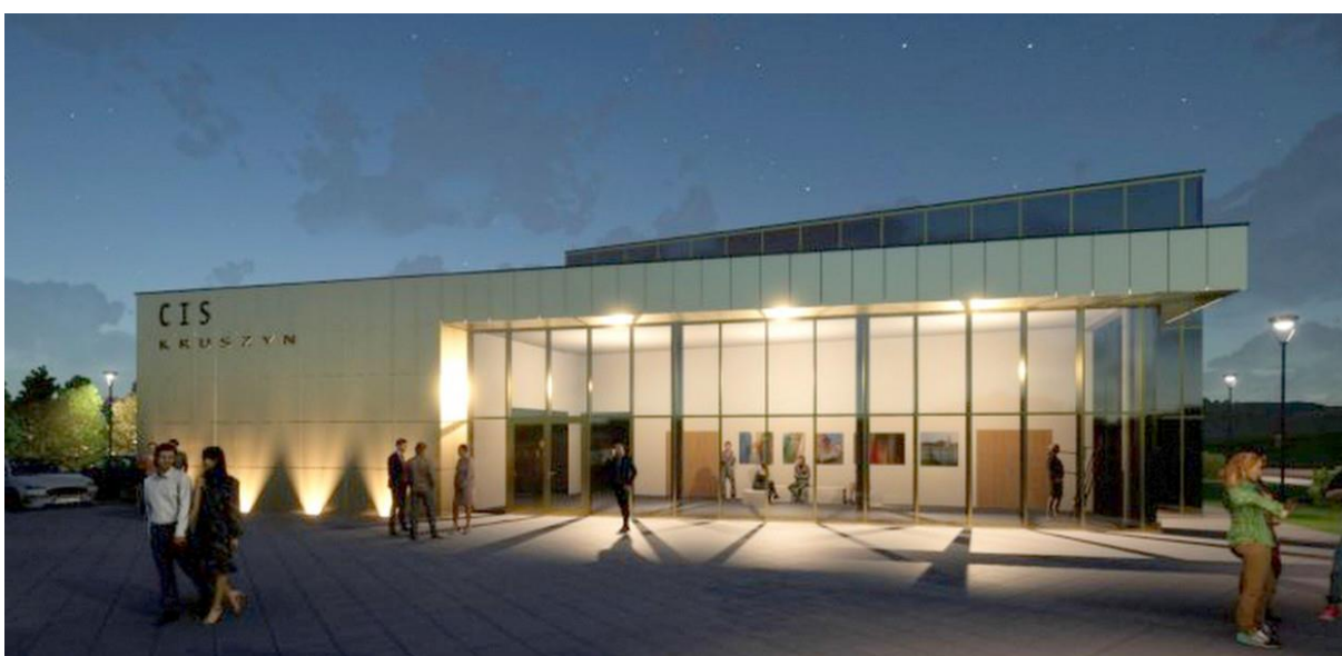
Centrum Integracji Społecznej w Kruszynie - wizualizacja.