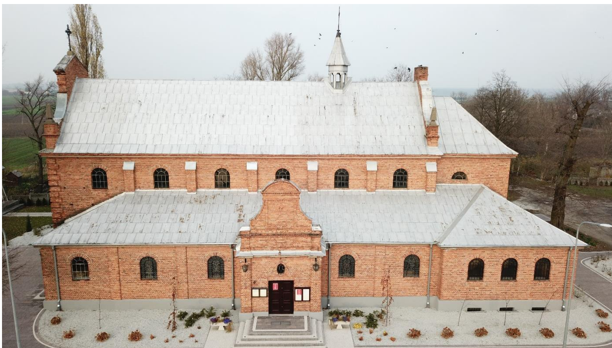
Kościół parafialny rzymskokatolicki murowany, p.w. Matki Boskiej Królowej Polski w Kruszynie