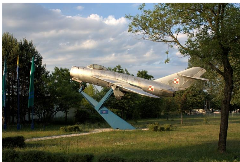
Aeroklub w Kruszynie im. Stanisława Skarżyńskiego

W miejscowości Kruszyn znajduje się lotnisko Aeroklub Włocławski. Lotnisko w Kruszynie było budowane w okresie 1962 – 1965, a zostało otwarte w dniu 19 stycznia 1965 roku. Aeroklub powstał w 1959 r. i od tamtego czasu szkoli pilotów i skoczków spadochronowych. Jego patronem jest Stanisław Skarżyński (1899-1942), polski lotnik sportowy i wojskowy, który w latach trzydziestych XX w. na jednomiejscowym samolocie RWD-5bis jako pierwszy Polak przeleciał przez Ocean Atlantycki. Lotnisko w Kruszynie jest ośrodkiem sportu spadochronowego, a także miejscem organizacji licznych imprez sportowo-rekreacyjnych, w tym międzynarodowych zawodów balonowych czy mistrzostw świata FAI modeli szybowców.