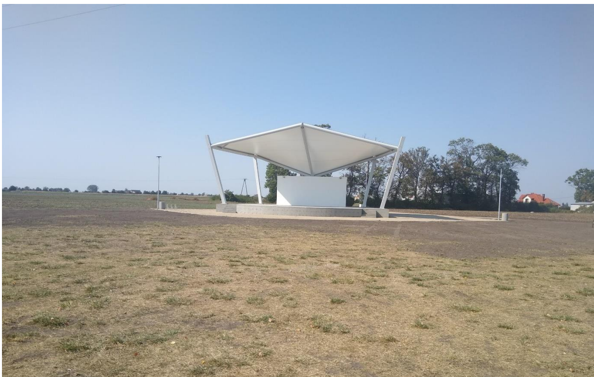
Scena letnia w Kruszynie.