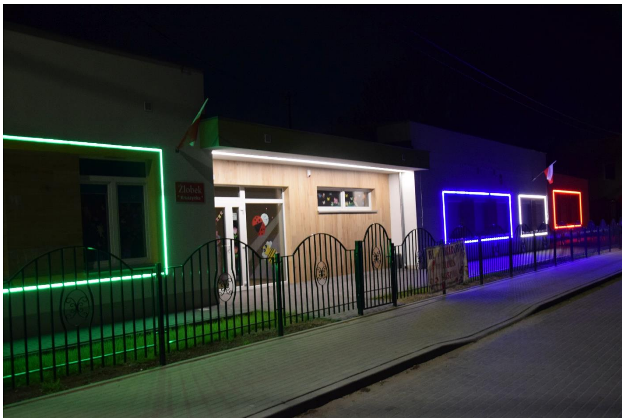
Budynek żłobka i przedszkola w Kruszynie.

Rolę placówki opiekuńczej dla najmłodszych mieszkańców Kruszyna pełni nowoczesny Żłobek „Kruszynka”, natomiast dla zapewnienia opieki najstarszym mieszkańcom powstał Dzienny Dom Seniora.