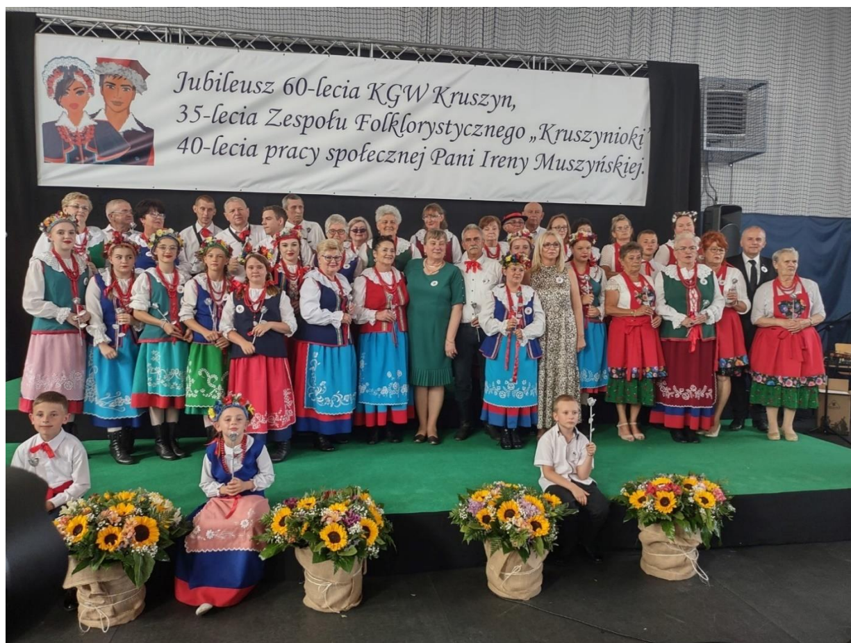
Zespół folklorystyczny „Kruszynioki”.

Dzięki Zespołowi Folklorystycznemu „Kruszynioki” stworzony został most międzypokoleniowy, który umożliwia pogłębienie więzi między pokoleniami poprzez dzielenie się wiedzą ludową, umiejętnościami i doświadczeniem. Jest to szczególnie ważne w środowisku, gdzie ludzie starsi stanowią istotną jego część, natomiast często skazani są na wykluczenie społeczne.