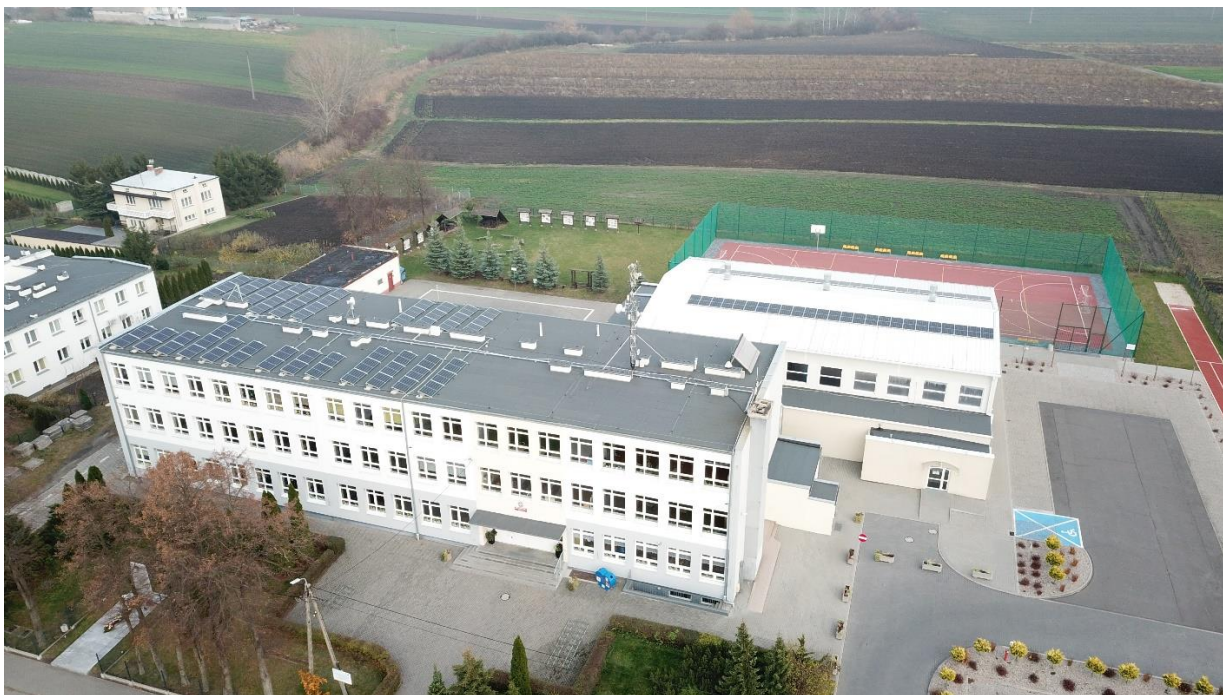
Szkoła Podstawowa z Oddziałami Integracyjnymi im. Polskich Noblistów

W Kruszynie znajduje się Szkoła Podstawowa z Oddziałami Integracyjnymi im. Polskich Noblistów wraz z oddziałem przedszkolnym, która wywiera istotny wpływ na aktywizację społeczności lokalnej. Przy szkole zlokalizowana jest infrastruktura sportowa, w tym boisko ze sztuczną nawierzchnią do koszykówki i piłki nożnej.