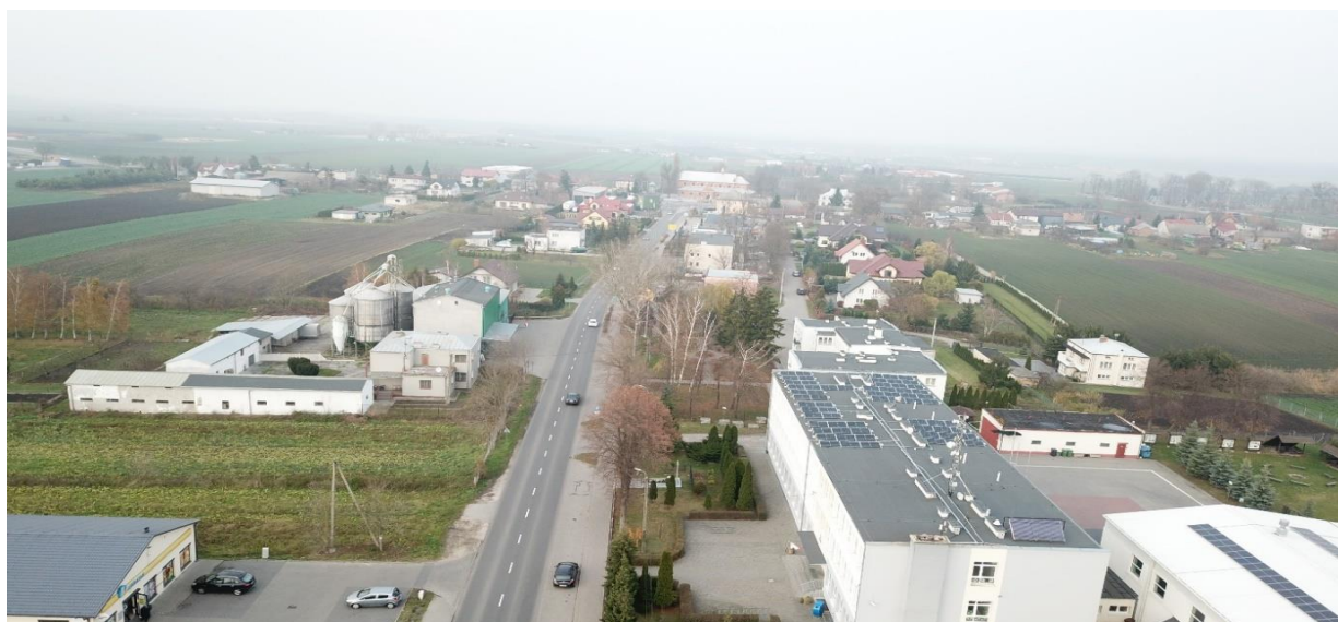
ul. Szkolna w Kruszyńce.

W Kruszyńce wybudowane są chodniki oraz oświetlenie uliczne, wyznaczone są odcinki do parkowania samochodów przy szkole oraz punktach usługowych. Ważnym miejscem dla integracji społeczności nie tylko miejscowości Kruszyn, ale wszystkich mieszkańców gminy jest boisko do piłki nożnej o nawierzchni trawiastej - odbywają się na nim wszelkie festyny, mecze, które gromadzą okoliczną społeczność. Ponadto, na terenie miejscowości znajduje się również boisko wielofunkcyjne o nawierzchni z poliuretanu zlokalizowane przy szkole podstawowej.