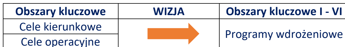
Tabela 3 Schemat ideowy budowy Strategii

Zaktualizowana Strategia rozwoju gminy Włocławek jest dokumentem definiującym kierunki rozwoju gminy w perspektywie 2030 roku, nie zawiera natomiast konkretnych rozwiązań – zadań i przedsięwzięć. Rozwinięciem zapisów Strategii będą programy wdrożeniowe zawierające szczegółowe i konkretne projekty.